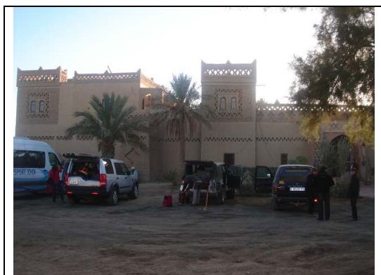
KASBA LE TOUAREG

Nunca había llevado tanta tierra y polvo encima. Ni cuando era pequeño y me revolcaba por tierra. Cenar y dormir.