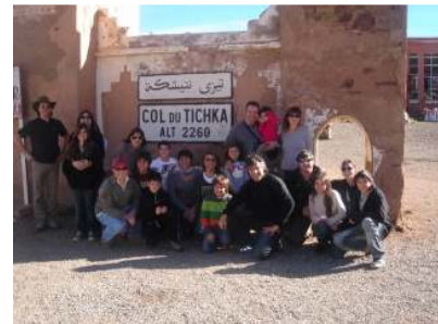
Aquí todo el grupo

Cruzamos el Atlas por un sitio seguro donde no haya nieve.